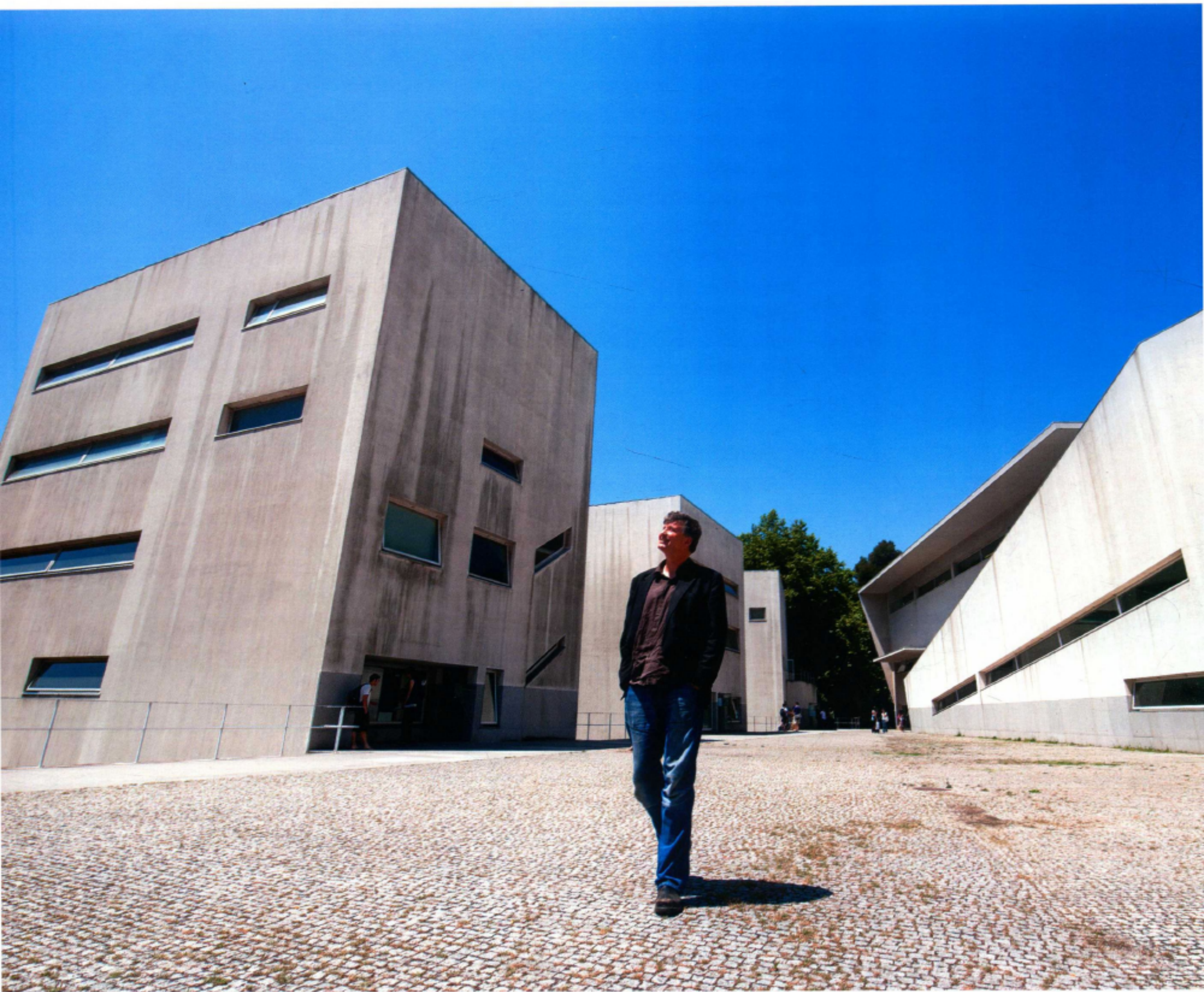
彼得·巴伯再次参观“非常动人”的波尔图大学建筑学院。