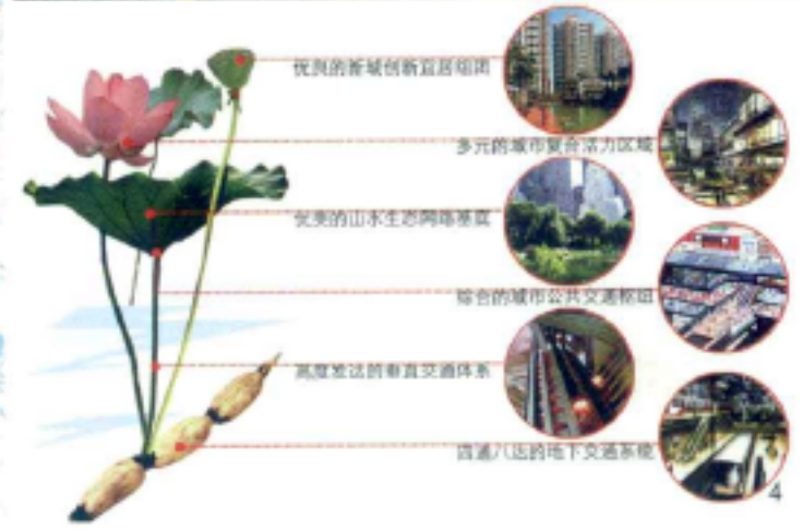
1.城北新城概念规划 2.地块周边分析 3.区位图 4.功能概念意象解构

便利，未来还将有轨道交通、快速巴士和水上浏览路线通过，且基地北侧是半山、皋亭风景区，基地内水塘、水道丰富，上塘河、大农港、丁桥港贯通基地，具有难得的优质生态资源，值得保护和挖掘。