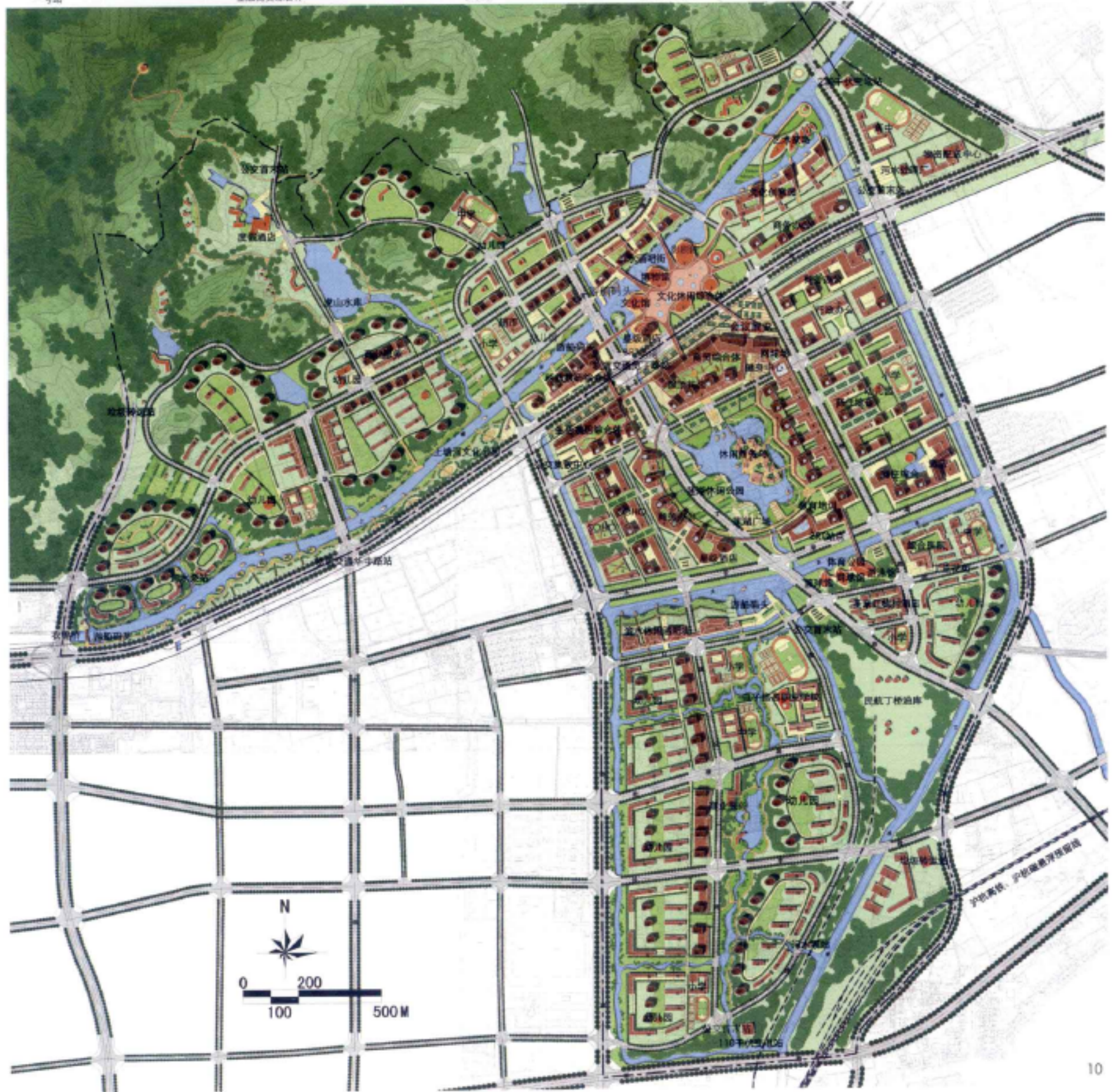
5.田园丁桥综合体鸟瞰 6.布局一核心引领，轴向生长 7.布局二水脉纵横，蓝绿映城 8.布局三多元组团，南华北曲 9.剖面图 10.总平面图