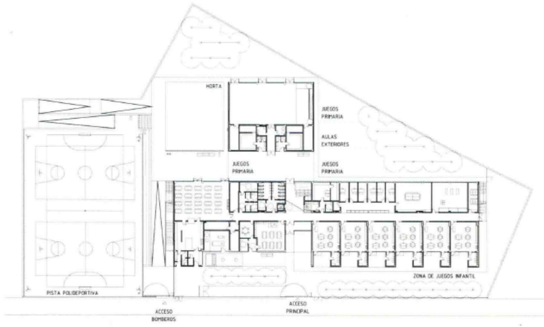
CALLE GULLEM OLIVER